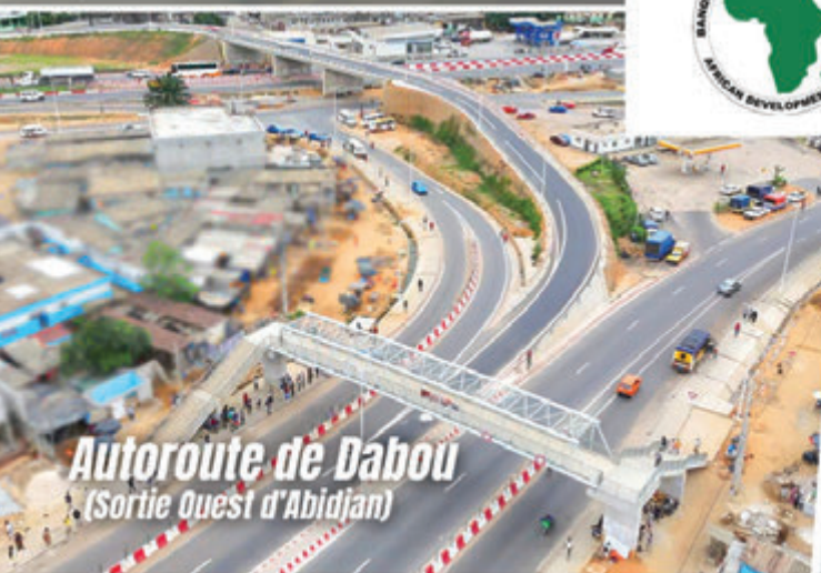
Autoroute de Dabou (Sortie Ouest d'Abidjan)