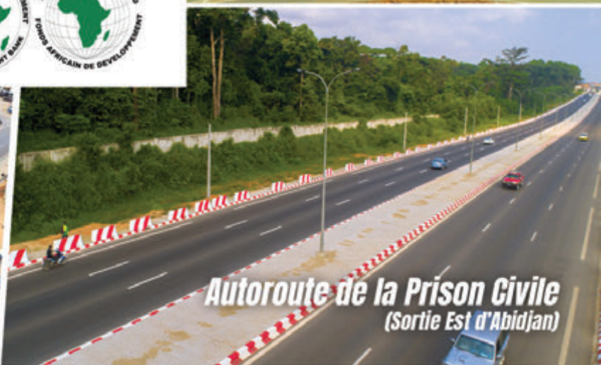
Autoroute de la Prison Civile (Sortie Est d'Abidjan)