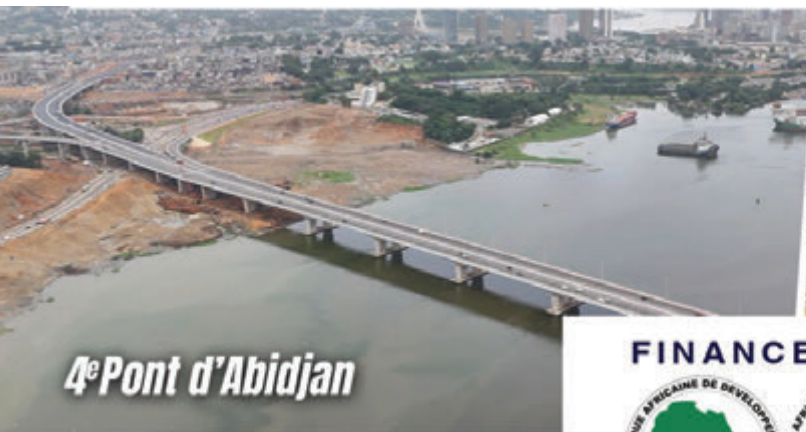
4 e Pont d'Abidjan