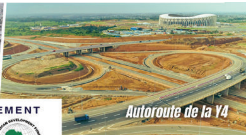
Autoroute de la Y4