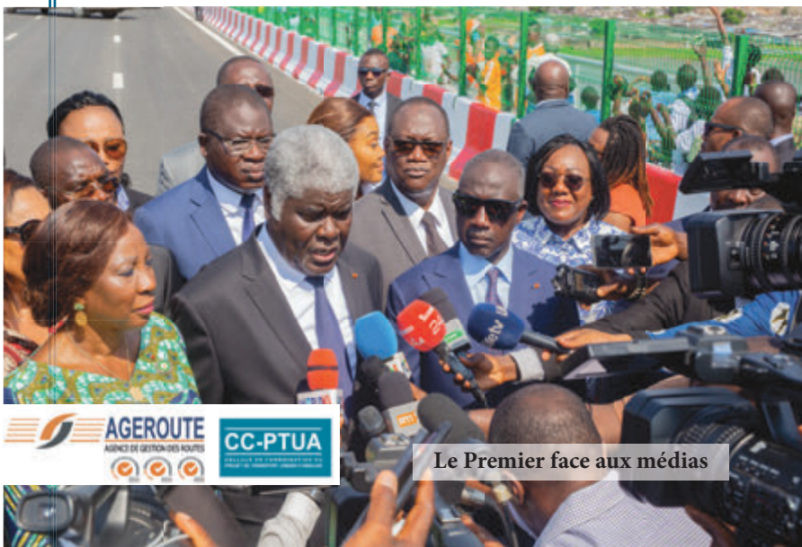
Le Premier face aux médias

Le Premier Ministre a recommandé la prudence et la discipline aux usagers lors de l'utilisation de ces infrastructures routières parce que les chantiers ne sont pas totalement terminés, en ce qui concerne la Y4 et le 4e Pont.