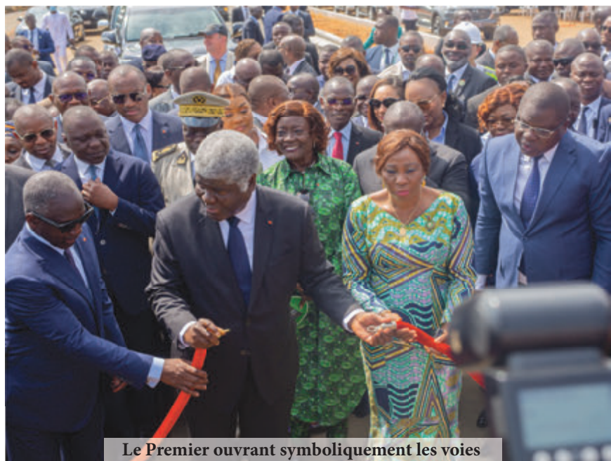
Le Premier ouvrant symboliquement les voies

La réalisation de ces infrastructures structurantes, s'inscrit dans le cadre d'un vaste programme d'investissement routier de l'Etat de Côte d'Ivoire et la Banque Africaine de Développement, visant à dynamiser les activités économiques du pays.