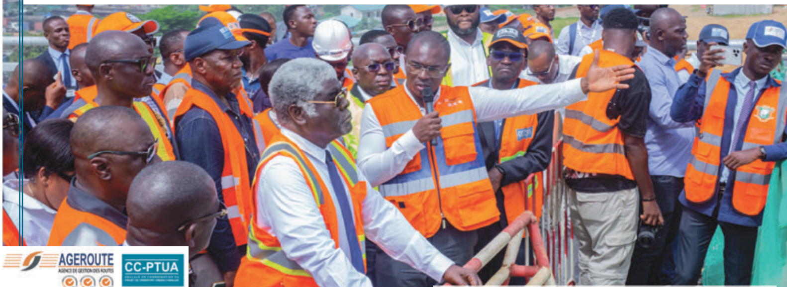
Le DG de l'AGEROUTE présentant l'avancement des travaux

Il faut rappeler que les Infrastructures routières ont joué un rôle important dans le succès de la can 2023, par la facilité d'accès aux stades.