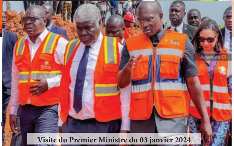
Visite du Premier Ministre du 03 janvier 2024

Ayant pris la parole, il avait rassuré, la presse présente, sur la mise en circulation effective de la Y4, des sorties Est et Ouest, de même que le 4e Pont d'Abidjan, dès le 10 janvier 2024.