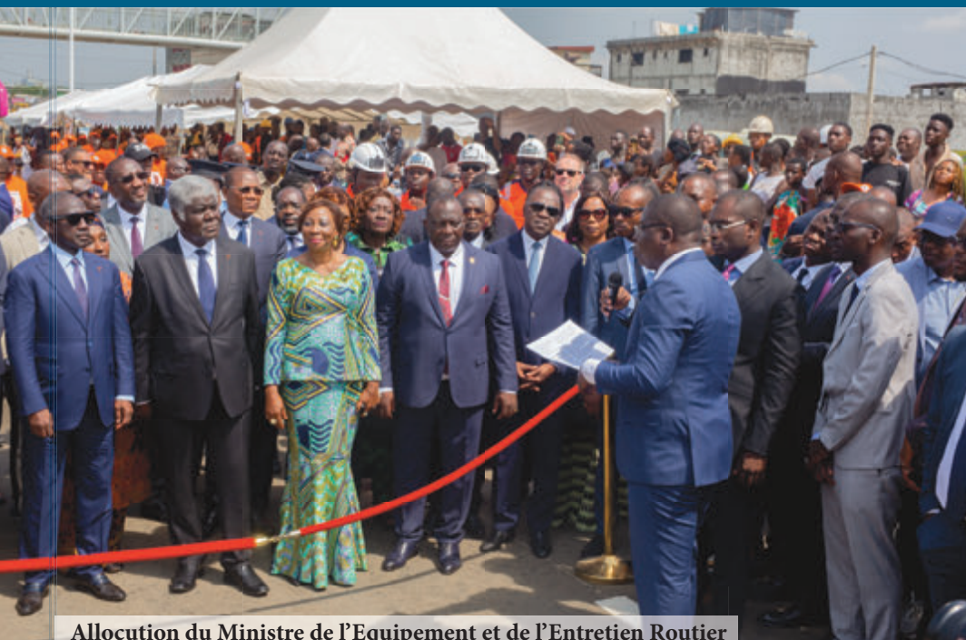
Allocution du Ministre de l'Équipement et de l'Entretien Routier

Le 10 janvier 2024, dans le District Autonome d'Abidjan, six infrastructures routières, dont celles du Projet de Transport Urbain d'Abidjan, à savoir : la voie de contournement d'Abidjan "Y4", les sorties Est et Ouest d'Abidjan, et le 4ème pont d'Abidjan, ont été partiellement ouvertes à la circulation par le Premier Ministre, Ministre des Sports et du Cadre de vie, SEM Robert Beugré Mambé.