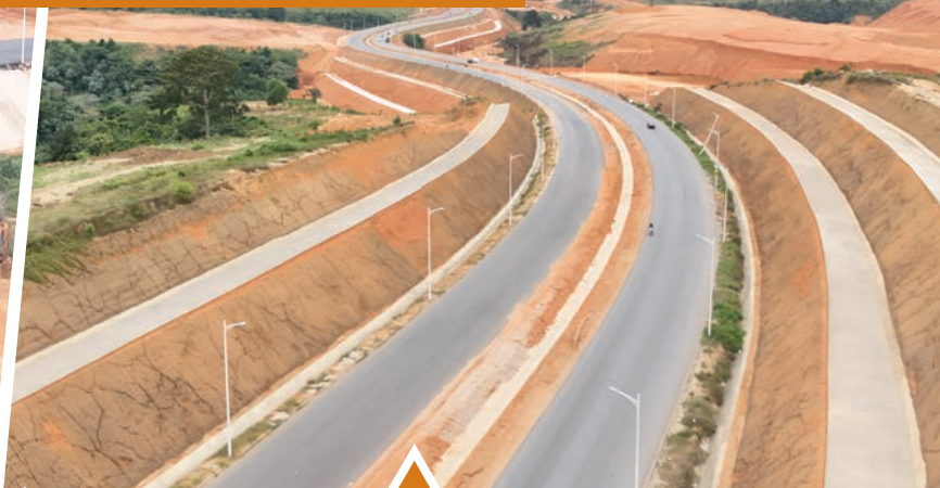
Vue entre Cocody et Abobo