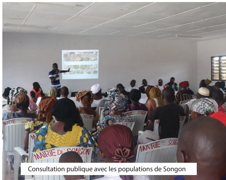
Consultation publique avec les populations de Songon

En prélude à ces consultations publiques, une campagne média d'information a été réalisée.