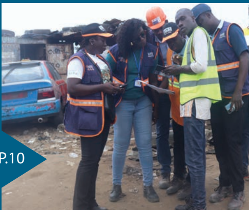
Visites d'études des voies de liaison

10 Préparation des projets de la phase 2 du PTUA