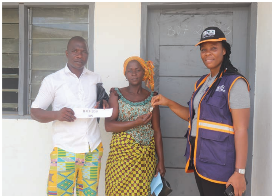
Cité Songon Ayewahi

Ce tirage s'est déroulé en présence d'un représentant de la justice ivoirienne afin de montrer la transparence dans l'attribution des logements.