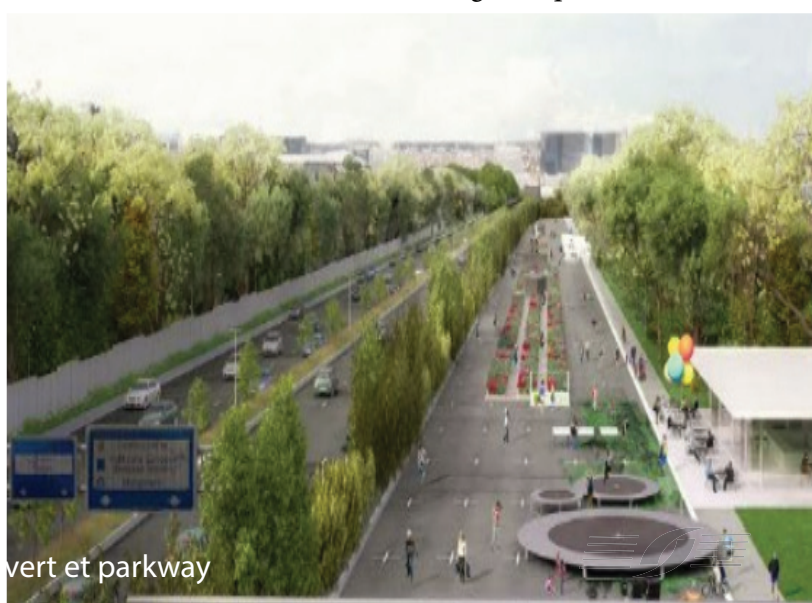
Illustration 3D plan vert et parkway