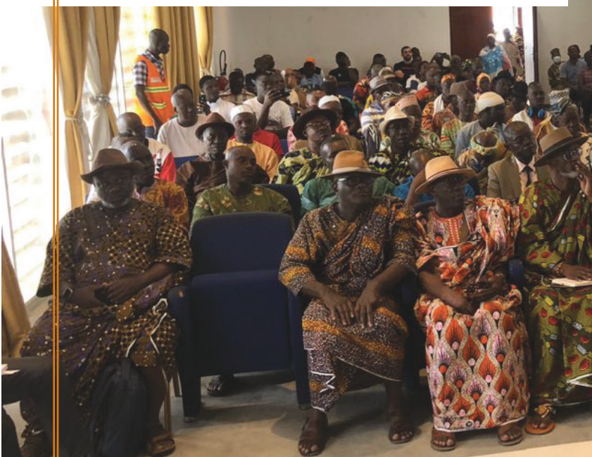
Consultation publique avec les populations d'Abobo