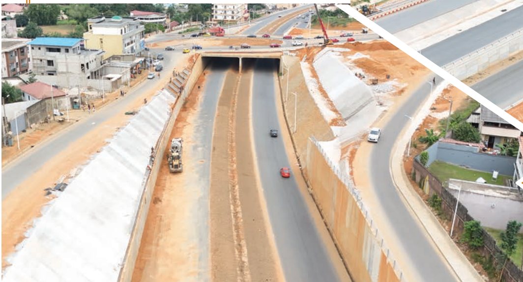
Echangeur à la traversée de la Riviera Palmeraie St Viateur