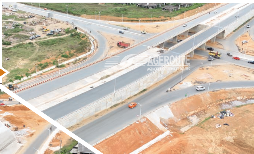
Echangeur à la jonction avec le Bvd Latrille