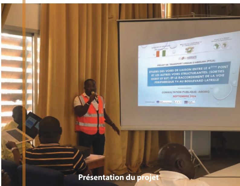
Présentation du projet