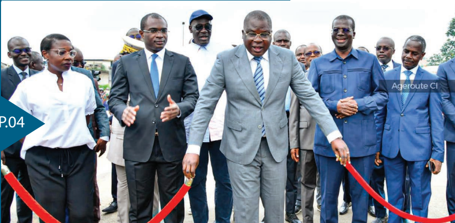
Le Ministre de tutelle ouvre la voies 4e Pont - Adjamé Mairie

04 Le Ministre de l'Équipement et de l'Entretien Routier ouvre officiellement la voie entre le 4e Pont et Adjamé Mairie ainsi que le péage.