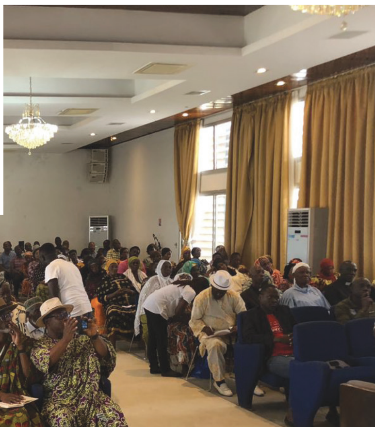
Consultation publique avec les populations de Yopougon