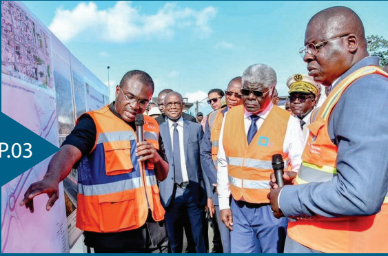
Le Premier Ministre visite le 4e Pont

03 Le Premier Ministre visite la fin des travaux de la phase 1 du 4e Pont d'Abidjan