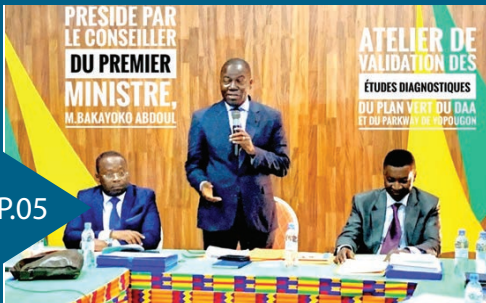
Validations d'études lors d'un atelier

05 Atelier de validation des études diagnostiques du plan vert du District Autonome d'Abidjan et celle du parkway de Yopougon