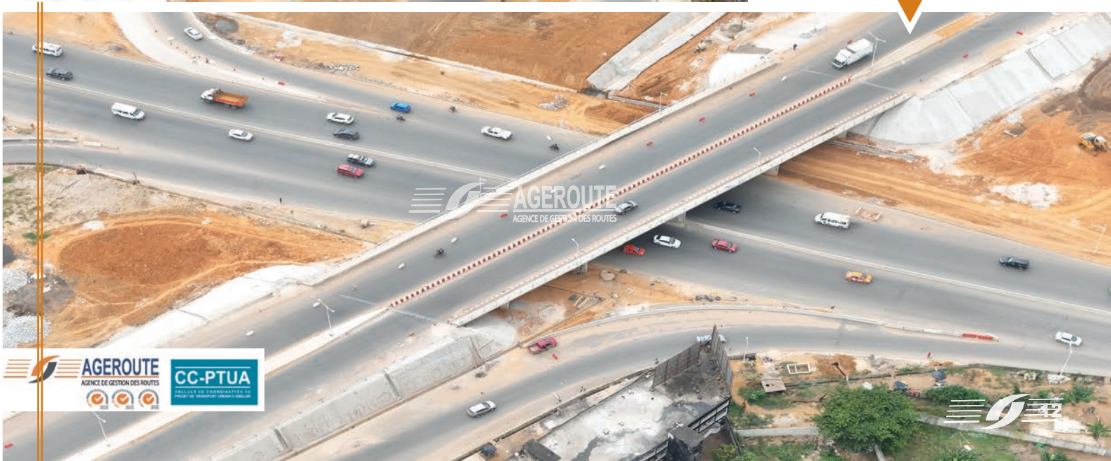
Echangeur à la jonction avec le Bvd Koffi Gadeau