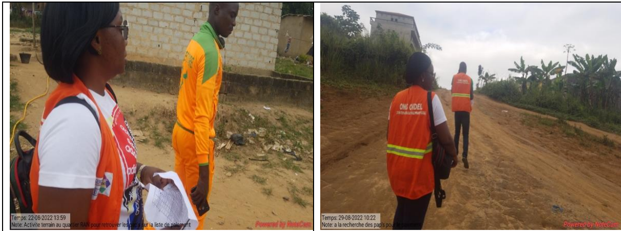
Recherche de PAP introuvables pour les négociations et les paiements