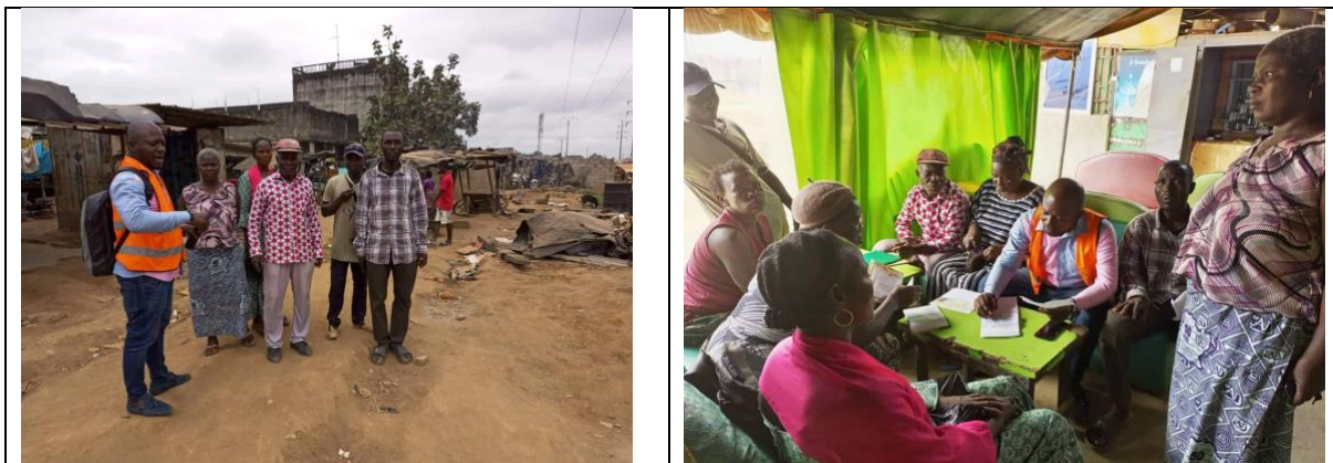
Sensibilisation PAP pour les négociations et les paiements