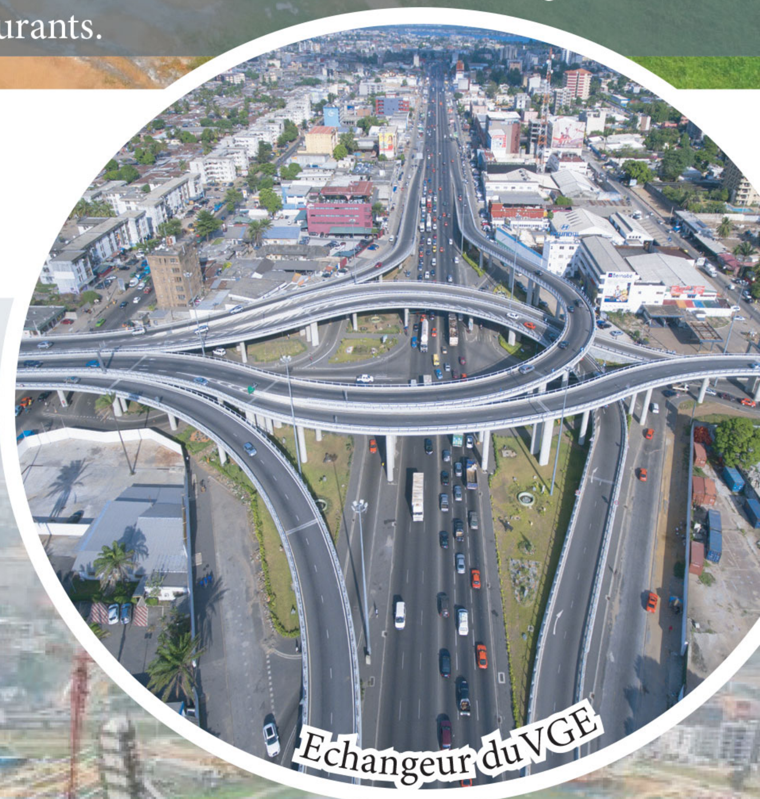
Echangeur du VGE

A Abidjan, ces ouvrages spéciaux ont connu un essor sans précédent ces dix dernières années grâce au développement des réseaux de transports terrestres. Leur construction a permis de contourner les obstacles naturels, et donc de réduire la durée du trajet des usagers.